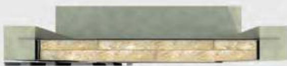
Ensamble de muro completo, recubrimiento mínimo 12"

Estos productos también ofrecen un desempeño óptimo en ensambles acústicos, así como en aplicaciones para el aislamiento de equipo mecánico.